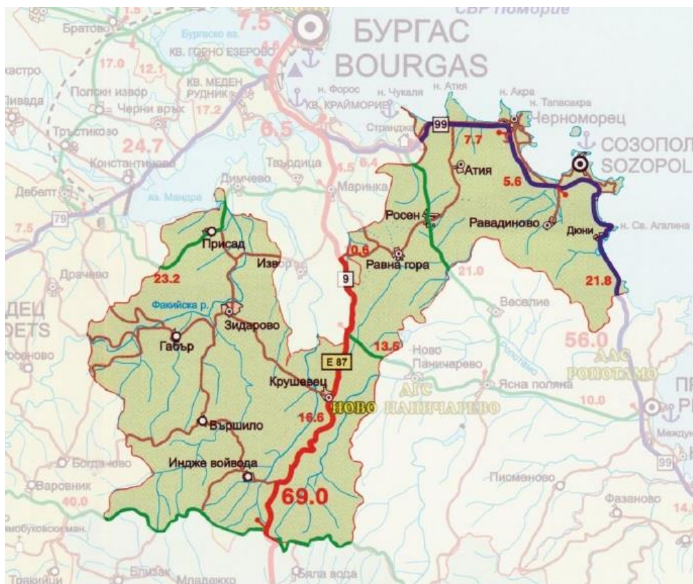
Фигура 1.13.1-1 Община Созопол

В административно отношение общината принадлежи към Област Бургас, а неин административен център е гр. Созопол. В състава на общината участват 12 населени места, от които 2 града – Созопол и Черноморец и 10 села – Равадиново, Атия, Росен, Равна гора, Крушевец, Зидарово, Присад, Габър, Вършило и Индже войвода.